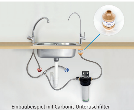
Einbaubeispiel mit Carbonit-Untertischfilter

Ich möchte mich bei Ihnen auf diesem Weg recht herzlich für ein echtes Stück Lebensqualität bedanken. Ich benutze Ihre Produkte mittlerweile seit mehr als zwei Jahren. Sie wissen von meinem Wunsch mich möglichst natürlich zu ernähren, und ich kann heute wirklich sagen, dass ich mich mit meinem Wasser sehr sicher fühle. Mit meinem Untertischfilter bin ich bis heute ausgesprochen zufrieden. Den „Frischekick“ des UMH Wirblers genieße ich wie am ersten Tag. Ich möchte heute kein anderes Wasser mehr trinken.