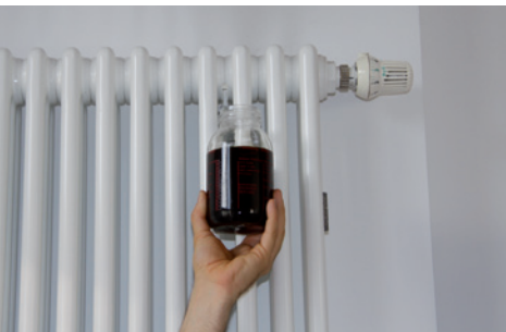
HEIZUNGSWASSER OHNE UMH

Gerne möchten wir über die Erfahrung mit den UMH-Heat-Geräten, welche wir in unsere zwei großen Häuser im Frühjahr 2011 eingebaut haben, berichten. Kürzlich wurden wiederum Wasserproben aus dem Heizungssystem entnommen. Wie schon bei früheren Inspektionen zeigte sich, dass das Heizungswasser völlig klar und schmutzfrei ist.